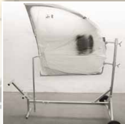
schnelle und vereinfachte Abklebearbeiten